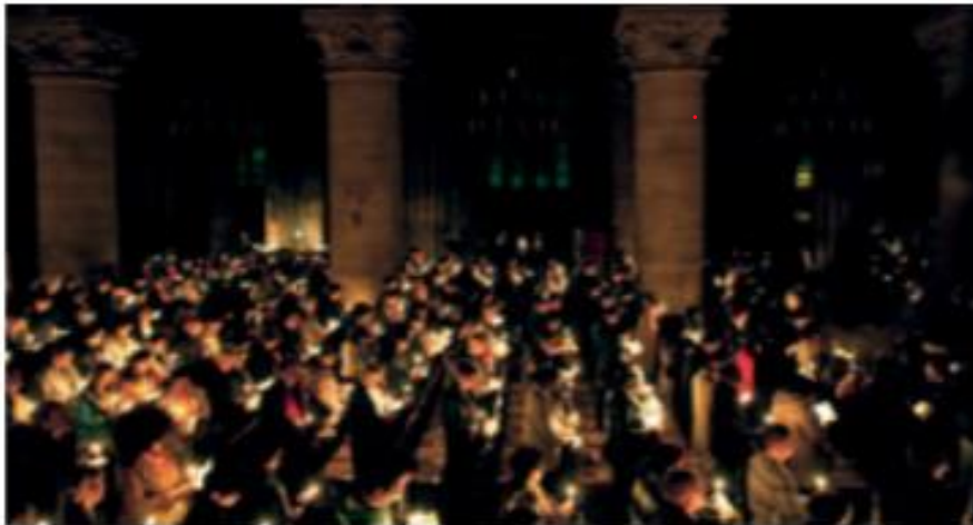
Los asistentes a la celebración de la vigilia Pascual encienden una pequeña vela. Su luz representa la resurrección de cada cristiano.